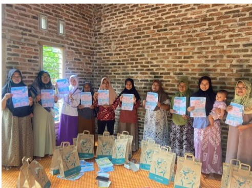
Gambar 1 Dokumentasi Penyuluhan

Berdasarkan hasil penyuluhan yang dilakukan menunjukkan adanya peningkatan pengetahuan masyarakat Dusun 4 Sukoharjo III Barat pada sebelum dan sesudah diberikan penyuluhan mengenai penyakit asam urat terhadap kesehatan.